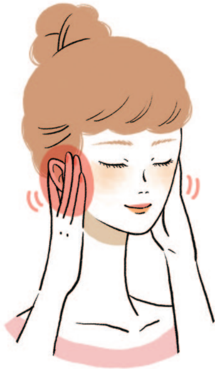
図6 唾液の分泌をよくする唾液腺マッサージ