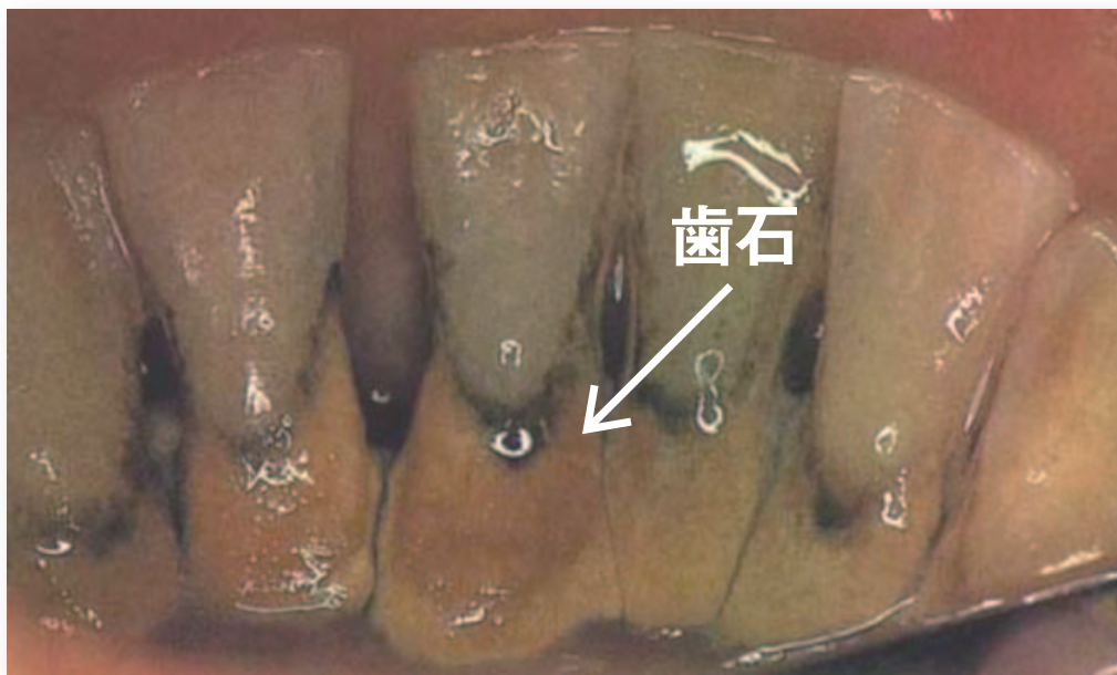
図7 内科治療における歯科治療の重要性